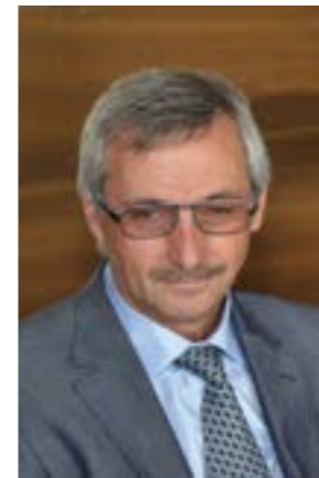
von Erwin Gritsch

Vom Platzl an der Staatsbrücke kommend fällt der Blick auf das Haus Nr. 3, in dem der große Arzt und Naturwissenschaftler Theophrastus Bombastus von Hohenheim, genannt Paracelsus, von 1540 bis 1541 lebte. Im Haus Nr. 7 befindet sich die Engel