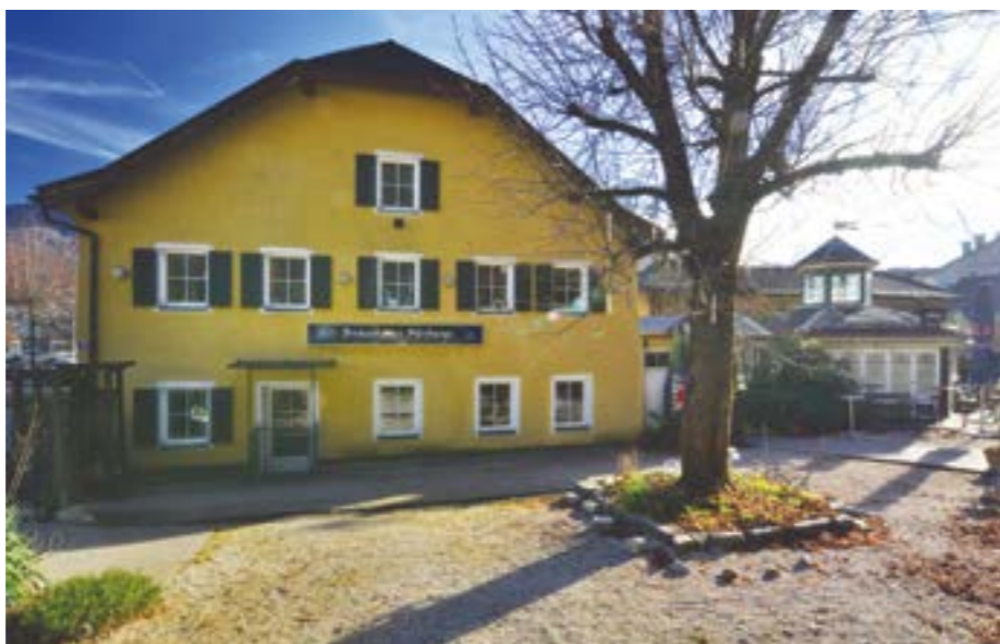
Das Brauhaus Fürbergs mit dem Salettl auf der rechten Seite

Beim Besuch des Fürbergs erwartet den Gast regionale und überregionale Schmankerl, spezielle Tagesaktionen zwischen 16:00 und 18:00 Uhr sowie