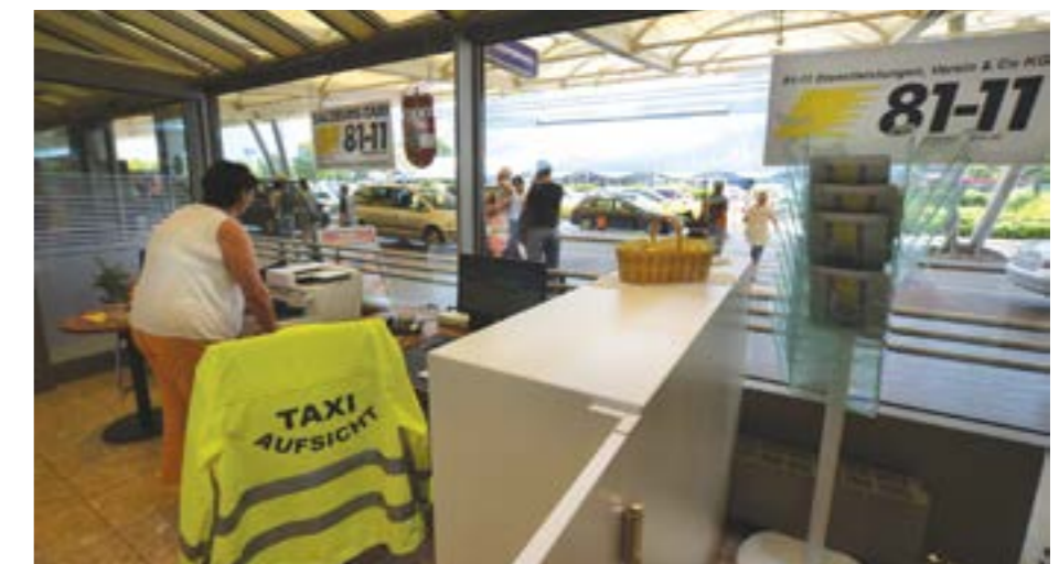
Im Bild: Das Büro der 81-11 Dienstleistungen, Verein & Co KG mit dem Taxi-standplatz im Hintergrund

Sofern das Urteil in Rechtskraft erwächst (eine Berufung ist möglich), ist dieses natürlich richtungweisend für alle anderen Gerichtsverfahren wie angeführt. Verwunderlich ist, dass die weiteren Klagen (ungeachtet der klagsabweisenden Entscheidung) nicht zurückgezogen werden. Im Fall der Rechtskraft haben die unterlegenen Kläger Erimescu an Verfahrenskosten knappe EUR 4.000,00 zu leisten. Unbeantwortet bleibt die Frage, ob es das wert war. ■