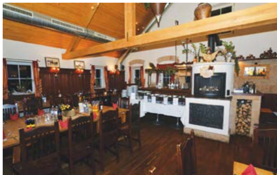
Die Gaststube im ersten Stock

Text: www.fuerbergs.com ; Wikipedia