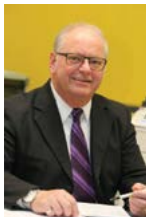
von Peter Tutschku