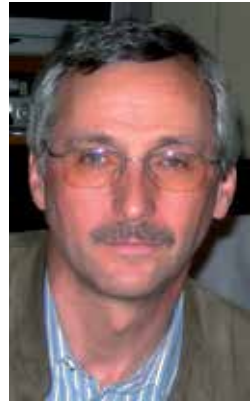
von Erwin Gritsch