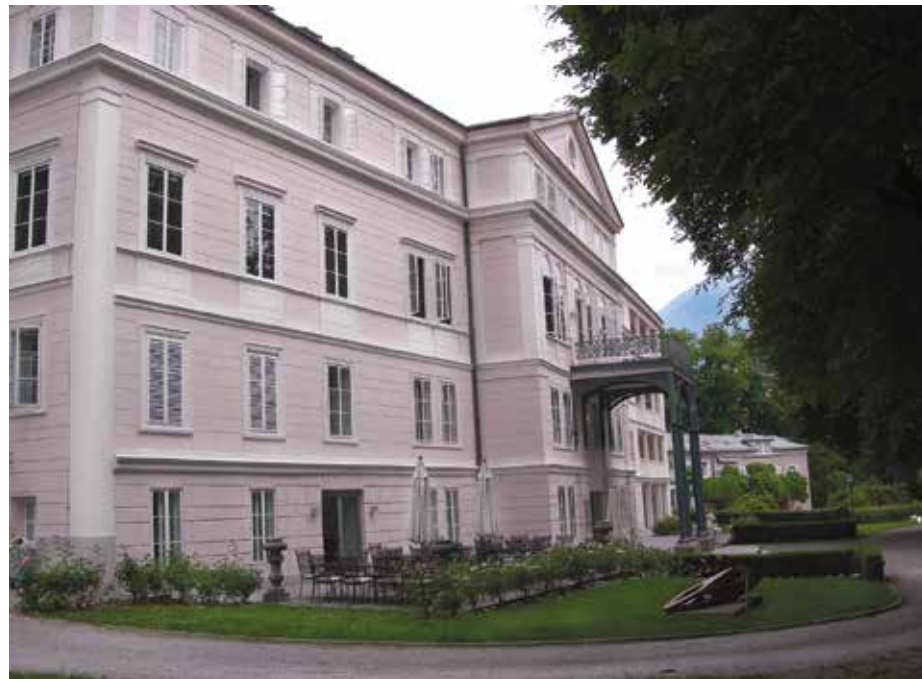
Die Ostansicht von Schloß Arenberg

sen ist. Besondere Bedeutung für Salzburg hat das Engagement von Prof. Würth in der Salzburg Foundation. Damit ist die Erhaltung des „Walk of Modern Art“ und die Erhaltung der darin enthaltenen Kunstwerke gesichert. ■